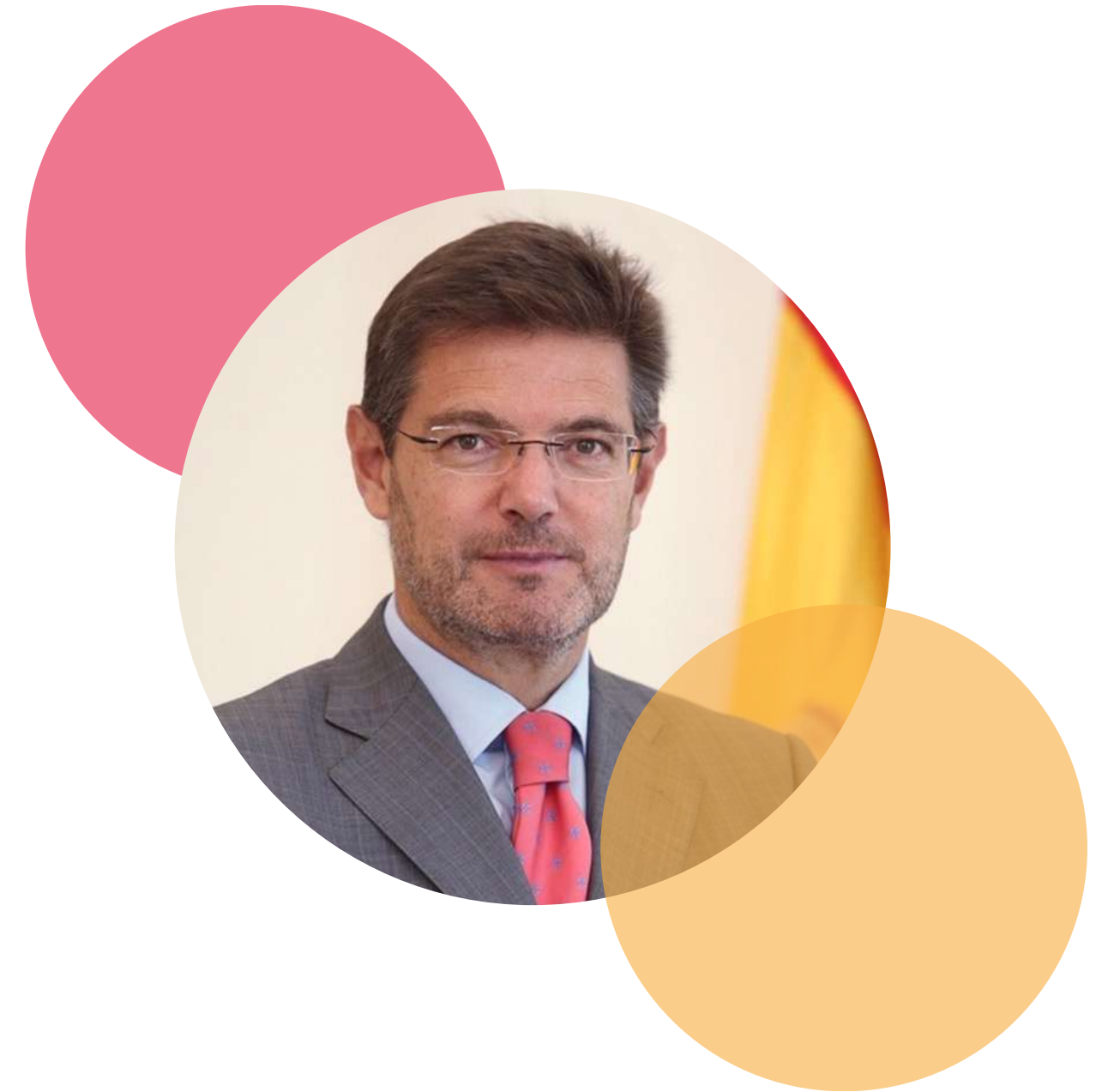
D. RAFAÉL CATALÁ PRESIDENTE DEL CENTRO ESPAÑOL DE MEDIACIÓN

Tanto su organización como actividad están orientadas a prestar a sus usuarios, y en particular a las empresas, un servicio de mediación excelente que ofrezca una alternativa efectiva al proceso judicial y a la vía arbitral.